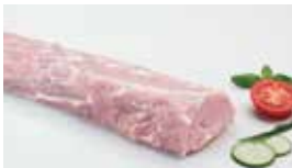
Rücken ohne Knochen