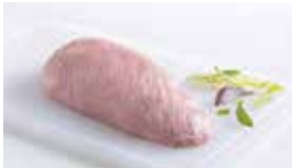
Oberschale ohne Deckel