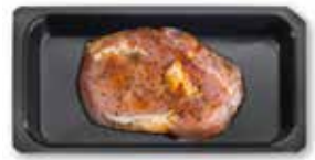
Ribeye Steaks mariniert