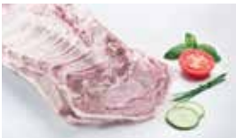
Rücken mit Knochen