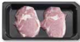
Ribeye Steaks natur